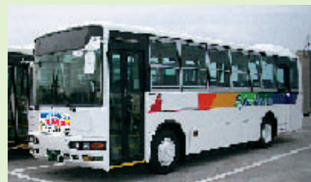
運行は中型バスを予定しています。

☆運行バス会社((株)琉球バス交通)のサイトからは停留所名や地図、路線一覧から簡単に目的のバス時刻表が検索できます。また、走っているバスの現在位置情報も知ることができます!