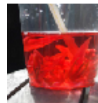
ローゼルジュース