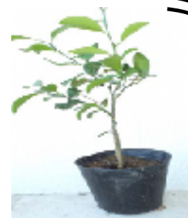
台木に使うシークワサー