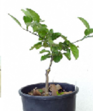
接ぎ木が成功したミカン苗