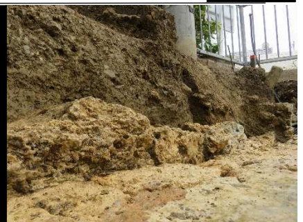
並んで発見された最下部の石

発掘担当者は「まさかこんな立派な敷石が残っているとは思わなかった。沢岬イリヌカーをナメてた。大変に申し訳ない。」と謝罪した。