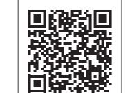
▲国勢調査について(市ホームページ)

国勢調査とは、沖縄県や浦添市の人口の男女構成比など、10月1日時点で、私たちの県や市に一人何人の人が実際に暮らしているのか等を把握するための調査です。5年に一度、全国一斉に、外国人も含めて日本に住む全ての人と世帯を対象として実施され、住民票のあるなしに関わらず実態人口を正確に調べる全数調査です。国勢調査と聞くとなんだか難しい感じがしますが、これは私たちの生活に関わるとても大切な調査なのです。