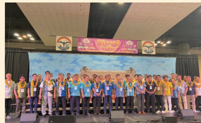
「ハワイ沖縄移民125周年記念式典」に参加してきました！