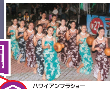
ハワイアンフラショー