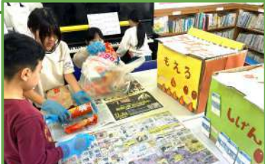
▲中身のチェックときちんと分別がされているか確認している様子

ラベルがついたままのものもありました。もっとみんなに知ってもらうために、ポスターや声かけも増やしていきたいです。これからも、きれいな広場を目指してがんばります!