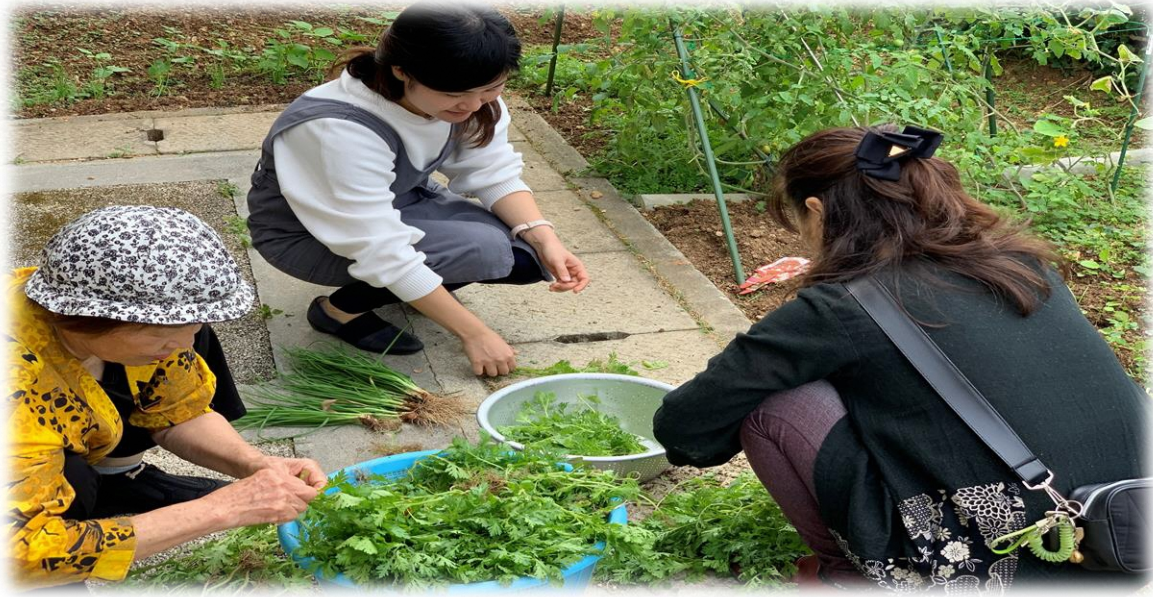
収穫した野菜は公民館や子ども食堂へ提供