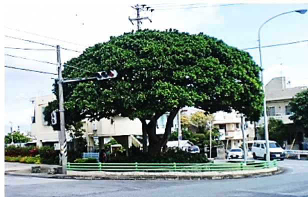
(事例) 浦添市牧港小近くの交差点