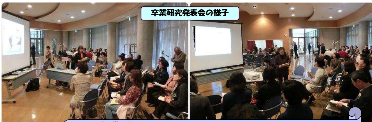
卒業研究発表会の様子

てだこ市民大学は、本市の「夢・まち・人」づくりの一環として、市民の学習ニーズの高度化・多様化への対応と学ぶ喜びの促進、自己実現への支援を行うとともに、そこでの学習成果を地域社会や学校教育に還元し、本市のまちづくりに寄与できる有為な人材（キーパーソン）を育成することを目的として開学しました。今回は、様々な学びの中から「卒業研究」をピックアップして紹介していきます。