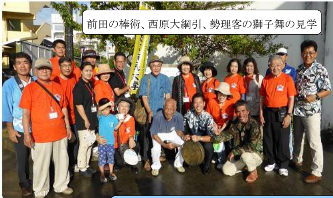
前田の棒術、西原大綱引、勢理客の獅子舞の見学

美術館や図書館、てだこホール等の普段は入ることが出来ないバックヤードも見学しました。学生からは「裏方の職員がここまでやっているんですね」との驚きの感想を頂きました。