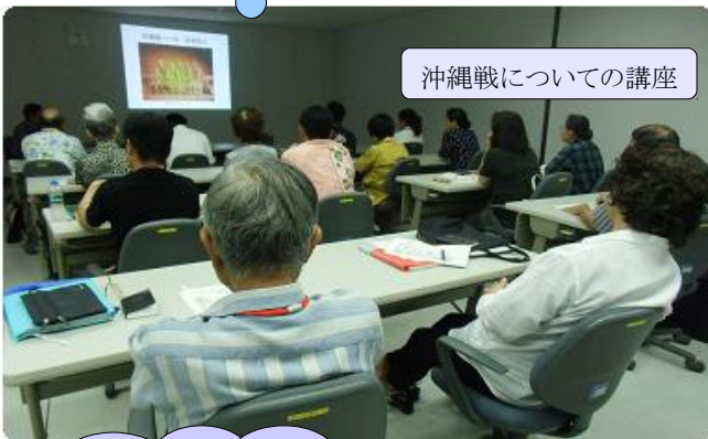
沖縄戦についての講座

学部概要: 歴史をはじめ、伝統芸能や様々な分野の芸術・文化を教養として身につけそれらを踏まえた文化振興の分野を専門的に学習し、地域のキーパーソンとして、琉球王国発祥の地「てだこの都市・浦添」の芸術・文化の創造に寄与する人材を育成する。