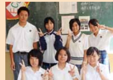
写真のテーマは「文化の秋」。浦添高校で行われたキラ星祭(文化祭)の様子を撮影しました。