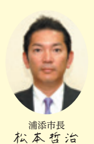
浦添市長 松本哲治

「すべての子どもに夢を!」 詳細については、学校配布のご案内または市ホームページをご覧ください。