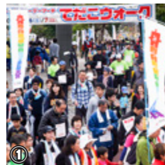
ふるさと納税で集まった寄附金は、次のような事業で活用されます ①てだこウォーク

確定申告の不要な人がふるさと納税を行う場合、確定申告を行わなくても寄附金控除が受けられる制度です。申請にはふるさと納税先の自治体に申請書を提出する必要があります。注意点として、5団体を超えての応募はできません。また他に確定申告を行う必要が無いこと。(医療費控除・保険料控除等)詳しくは市ホームページをご覧ください。