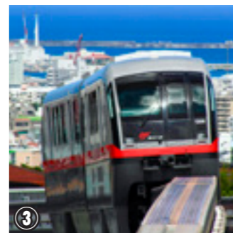
③沖縄都市モノレール事業