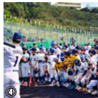
④東京ヤクルトスワローズ事業