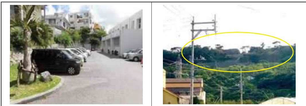
写真⑧. 当山小学校から見える浦添城跡