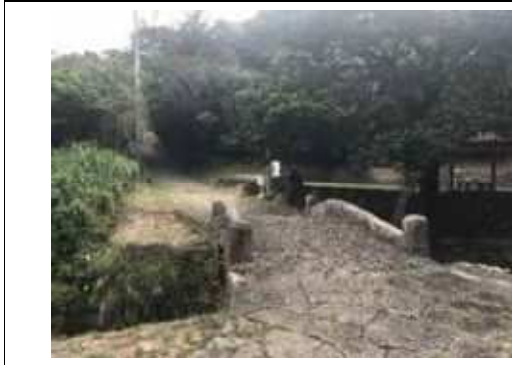
写真⑨. 牧港川を横断する普天間参詣道