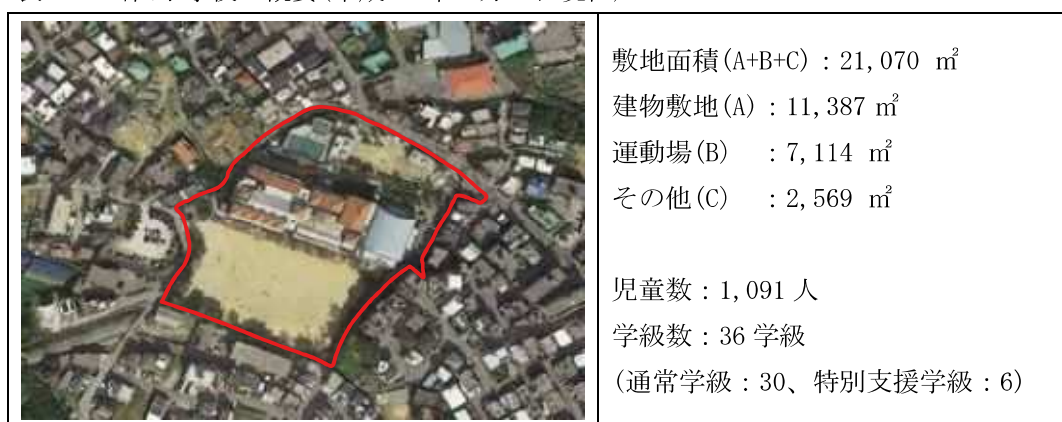
表 2.1 当山小学校の概要(平成 29 年 5 月 1 日現在)

当山小学校は、平成 29 年 5 月 1 日現在において児童数が 1,091 人、学級数が 36 学級であるため文部科学省が示す過大規模校(31 学級以上)となっている。また、当山小学校が保有する通常教室数は 31 であり通常教室数が不足している状態のため、特別教室を転用して教室数を確保している状態である。(表 2.2 参照)