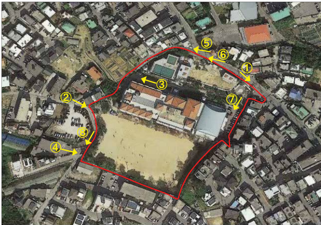
図 2.2 当山小学校周辺の写真方向図