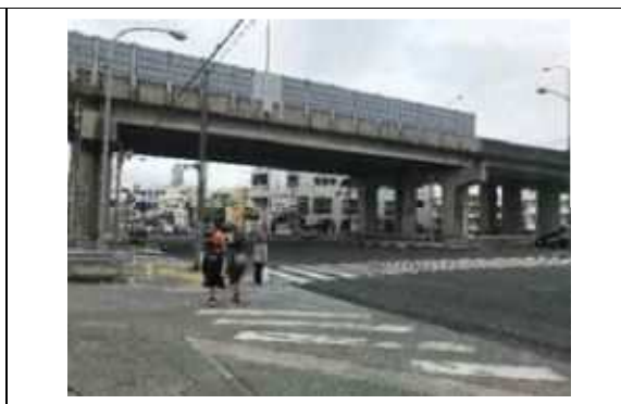
写真④. 小学校区を縦横断する国道 330 号と県道 241 号線