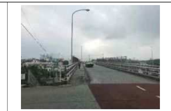
写真⑥. 国道 330 号に架かる道路 2