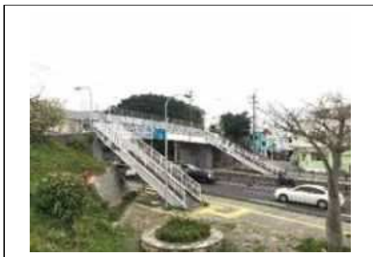
写真③. 国道 330 号に架かる歩道橋