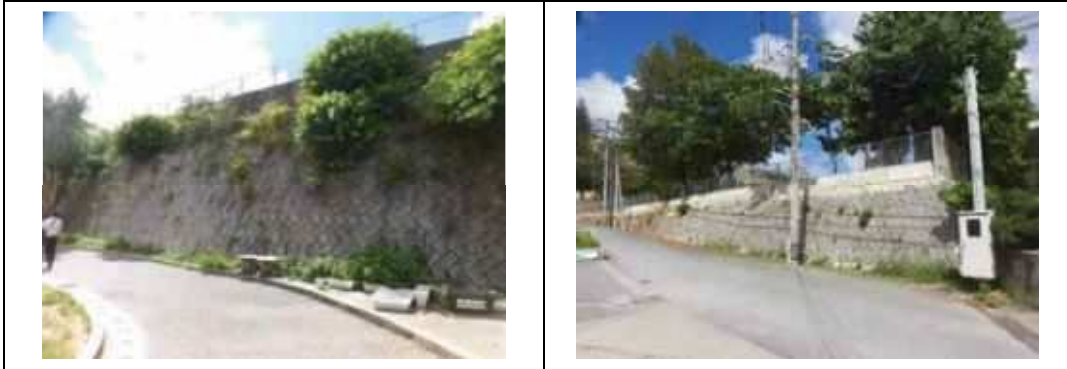
写真④. 学校側の間地ブロック