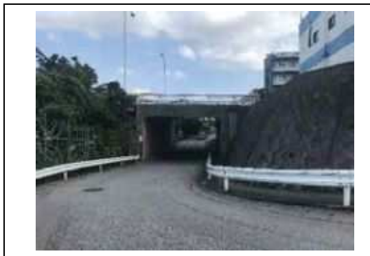
写真⑦. 国道 330 号を横断するトンネル