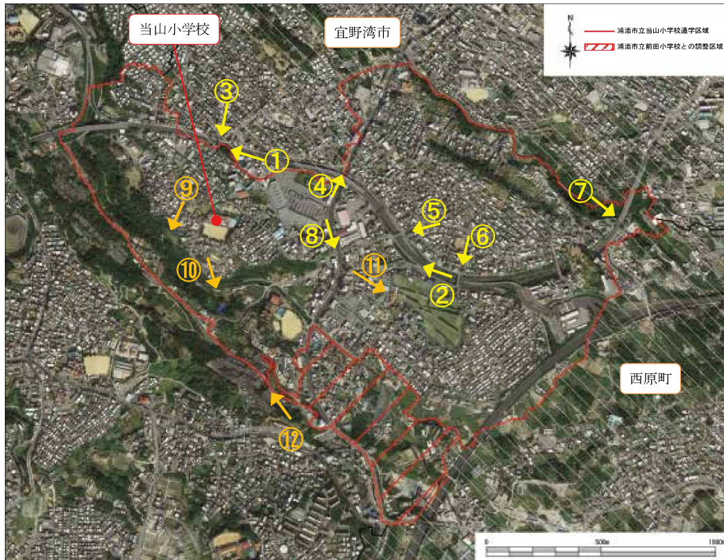
図 2.3 当山小学校区の写真方向図

当山小学校区は、浦添市の東側に位置しており、北側は宜野湾市、東側は西原に接している。南西側には大規模な浦添大公園及び墓地が位置し、地区内には、牧港川が縦断し、牧港川沿いには斜面緑地が残されている。また、区域内には西原インターがあり、今後整備予定のたご浦西駅、幸地 I C により利便性の高い交通結節拠点が形成される。当区域は、西原、当山などの旧集落や区画整理事業による市街地によって形成されている。