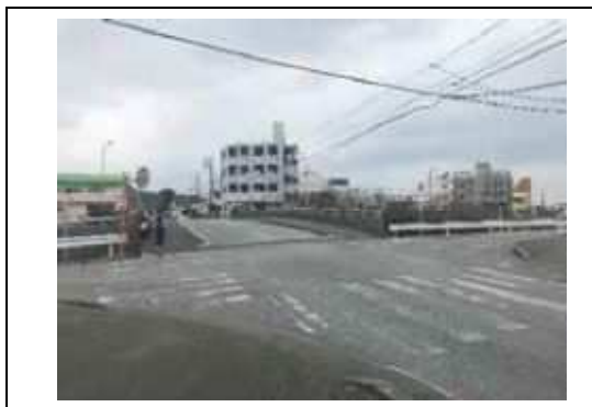
写真⑤. 国道 330 号に架かる道路 1