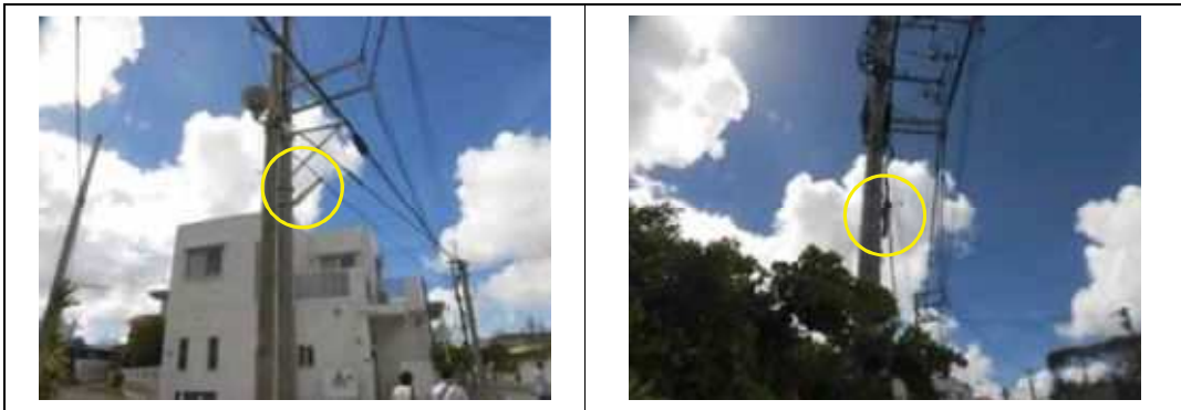
写真⑥. 小学校周辺の外灯