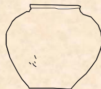
宮古式土器 ～1670年頃 【転用蔵骨器】