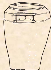
ポージャー厨子甕 1650～1790年頃