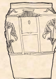
マンガン掛け厨子甕 1770～1950年頃