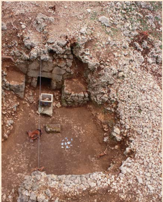
▲ 掘込墓 A地区6号墓