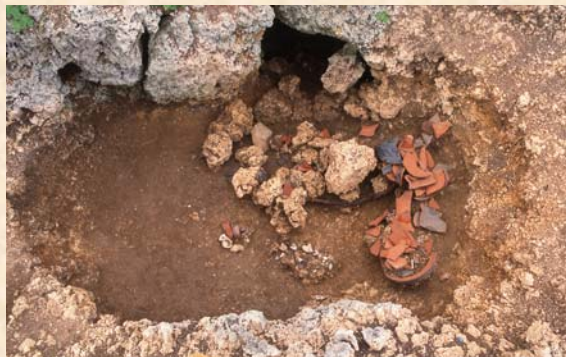
▲ 岩陰の掘込墓 A地区1号墓