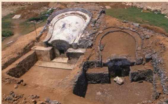
▲ B地区の亀甲墓 左：1号墓 右：2号墓