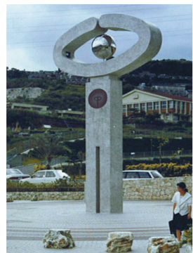
未来を見つめる目