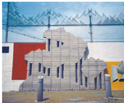
壁面とレリーフとフェンス