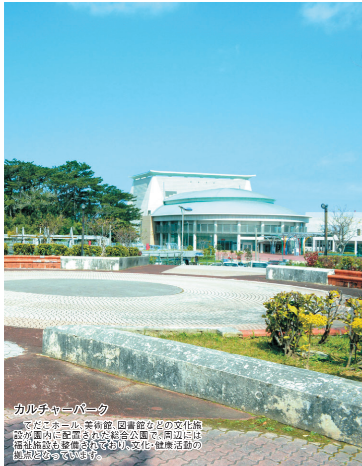
カルチャーパーク

市内で見ることのできる主な植物をあげると樹木ではガジュマル、リュウキユウマツ、デイゴ、ホルトノキ、フクギなど、草花ではシマアザミ、リュウキユウスミレ、テッポウユリ、セイヨウタンポポ、ヒマワリ、オオバナアリアケカズラなどがあります。