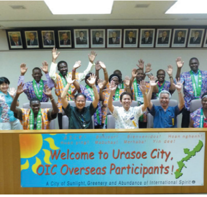
一万人目の研修員を迎えた市長表敬