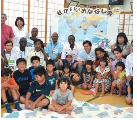
移動図書館「としまる」の巡回に合わせて開催された世界のおはなし会