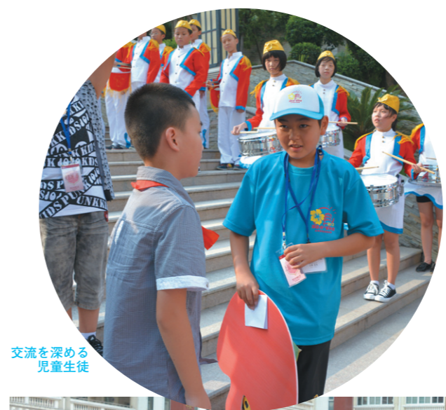
交流を深める児童生徒