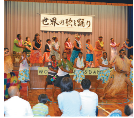
国際協力・交流フェスティバルでは研修員がダンスを披露