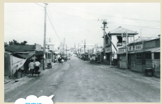
屋敷祖 大通り 1960年代