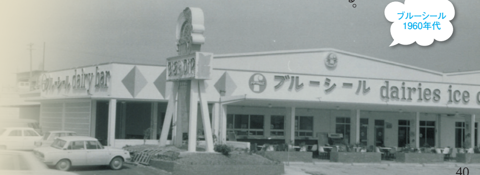
ブルーシール 1960年代