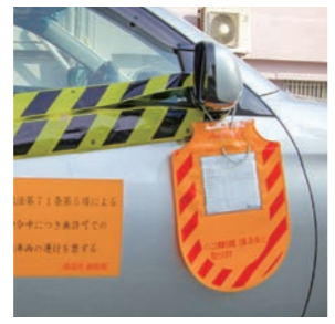
▲滞納処分でミラーズロックされた車

土地、建物、預貯金、給与、生命保険、自動車、動産などの差押えを実施します。 ※差押えに伴い、自動車のミラーズロック(タイヤロック)を実施することがあります。