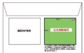
納税通知書等封筒裏面

募集方法 「申込書」(広告原稿)等の提出を求めます。 募集期間 11月1日(月)～19日(金)午後5時までに必着