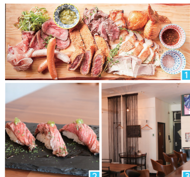
1 ポリウム満点肉盛り7種 2 ここでしか食べられない肉寿司 3 落ち着いた雰囲気店内

肉バル×スポーツ 牛レアカつとお好きな ドリンクで乾杯! 今月は、牛レアカつで那覇めしぐらアプリを受賞し、県内に13店舗展開されている「バルコラボ 肉バル」の、浦添店を紹介いたします。 いろいろな肉料理やアラカルトと共に、リーズナブルな飲み放題プランで、ビールやハイボール、自家製のサングリアなどが楽しめます。特にポリウム満点の肉盛りは圧巻で写真映え間違いなし!他にも当店限定のオリジナルメニューもあり、なんと系列店で肉寿司が食べられるのはこだけ! 店内は、落ち着いた雰囲気です。食事を楽しめますが、大型テレビも設置しており、時には皆でわいわいスポーツ観戦や応援をしながら盛り上がりましょう! ご家族や友人、デートなどのさまざまなシーンで楽しめます。ぜひ行かれてみてはいかがでしょうか。 ※だこ商品券も利用できます。