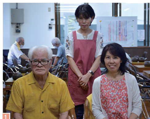
浦添囲碁会館 ▼詳しくはこちら