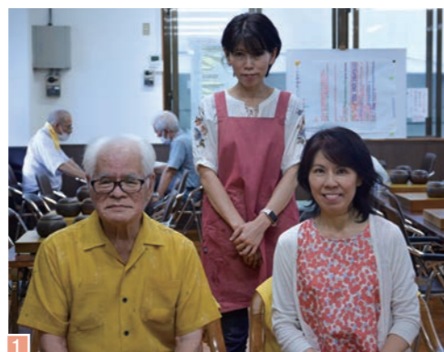
浦添囲碁会館 ▼詳しくはこちら