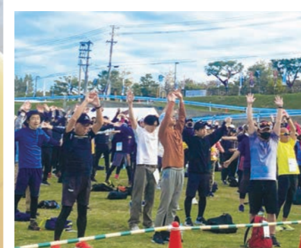
しっかり準備体操♪