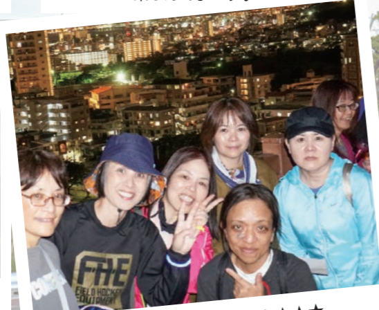
展望台で綺麗な夜景と★★★★