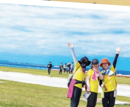
西海岸をバックに♪