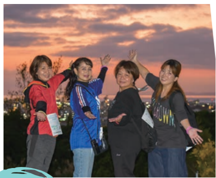
綺麗な景色と私たち♡