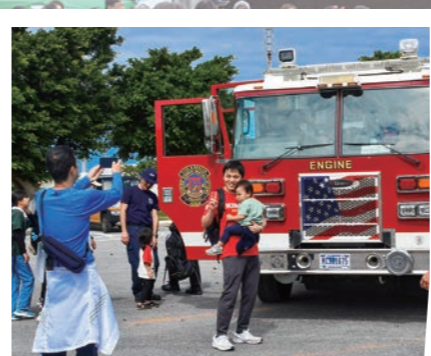
基地内消防車と「はい、チーズ!」