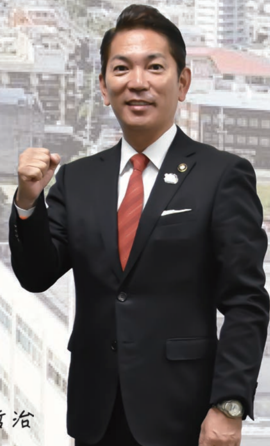
浦添市長 松本哲治

本市の東側では、沖縄都市モノレールが令和5年に3両化運行を開始する中、駅周辺のまちづくりを進めています。とりわけ交通結節点として東の玄関口である、てだこ浦西駅周辺では、分散型エネルギーを活用した官民連携による複合施設の事業実施を進めており、環境的価値、社会的価値、経済的価値の最大化を目指したまちづくりを「環境未来都市」と位置づけ取り組みます。