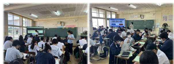
英語科教諭とALTのチームミーティング 生徒用電子教科書活用の英語授業