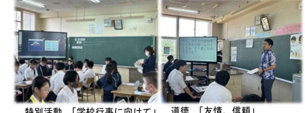
特別活動、「学校行事に向けて」 道徳、「友情、信頼」