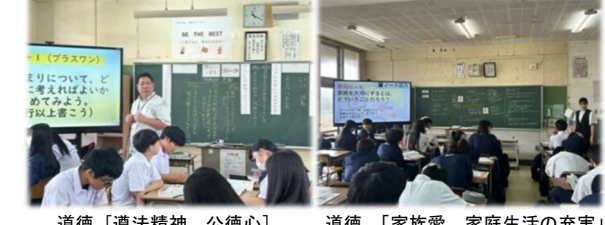
道徳、[遵法精神、公德心]