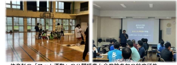
体育科の「マット運動」の公開授業と全教諭参加の校内研修