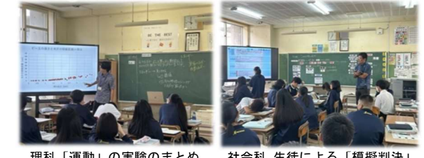
理科「運動」の実験のまとめ